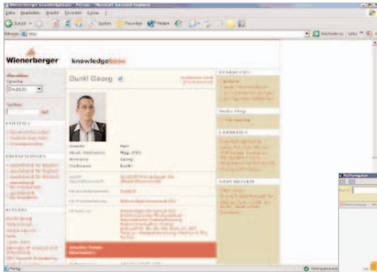
Der Mitarbeiter auf einen Blick: von Wissensgebieten, Projekten und Fähigkeiten bis zum Weiterbildungsbedarf